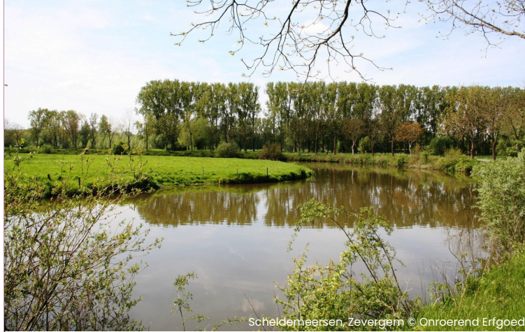
Scheldemeersen, Zevergem