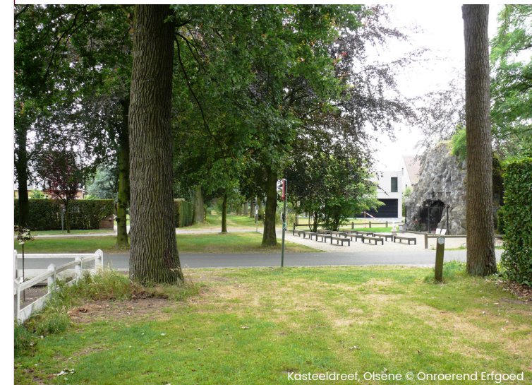
Kasteeldreef, Olsene