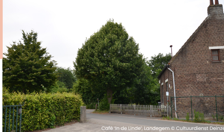
Café 'In de Linde', Landegem