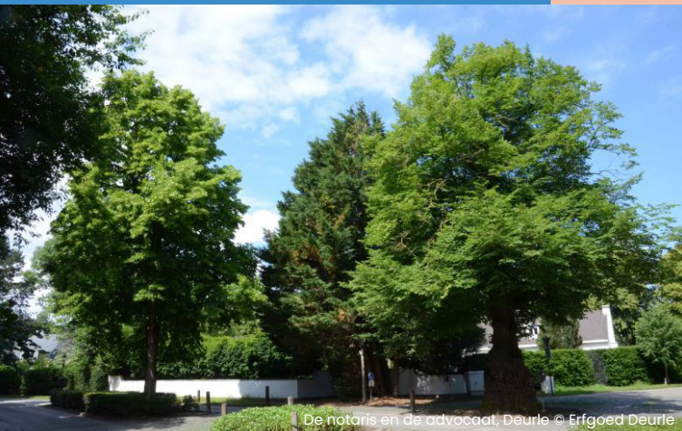
De notaris en de advocaat, Deurle

Organisatie: Erfgoed Deurle en gemeente Sint-Martens-Latem