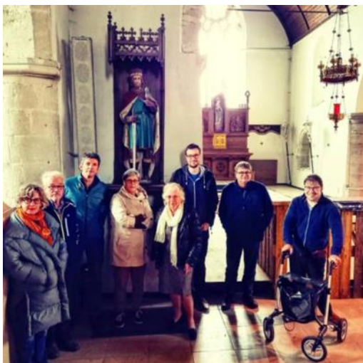
Startdag collectiezorgtraject Kerk Baaigem.

Meer informatie over de acties die de erfgoedcelwerking uitvoerde in 2021, vindt u in dit jaarverslag terug.