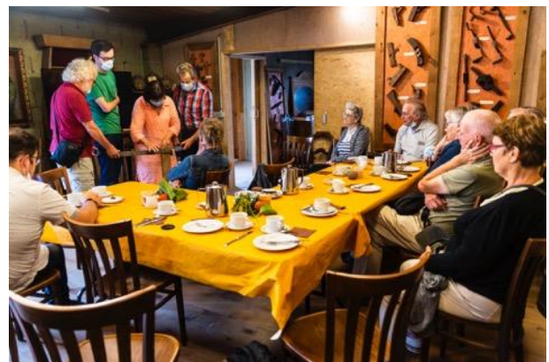
Collegagroep heemkringen en erfgoedverenigingen op bezoek in het Kuipersmuseum in Nevele.